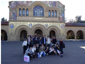
サンタクララ研修：スタンフォード大学見学