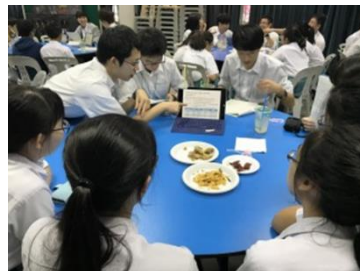
シンガポール研修：Swiss Cottage での研究交流