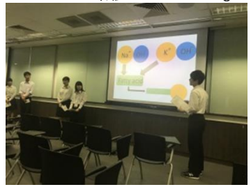
シンガポール研修：シンガポール国立大学で研究発表